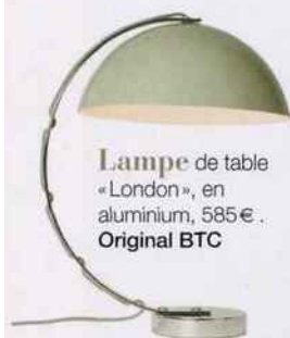
Lampe de table «London», en aluminium, 585€.. Original BTC