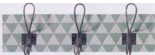
Patère « Vestiaire », en MDF et métal, 40 x 5,3 x 14 cm, 18,90 €. Delamaison