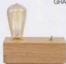
Lampe à poser «Kobe», en bois de Frêne, 79€.. It's About RoMi chez LightOnline