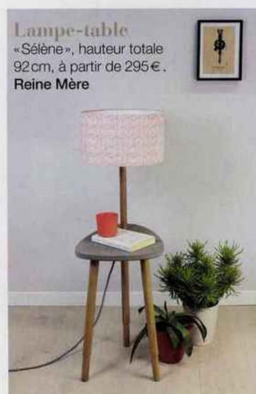
Lampe-table « Sélène », hauteur totale 92 cm, à partir de 295 €. Reine Mère