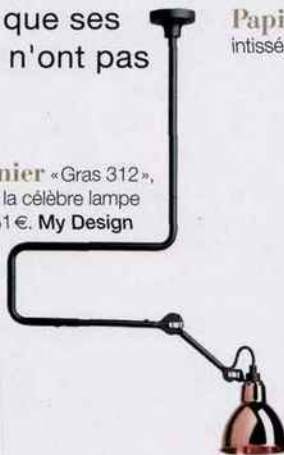
Plafonnier «Gras 312», inspiré de la célèbre lampe GRAS, 351€. My Design