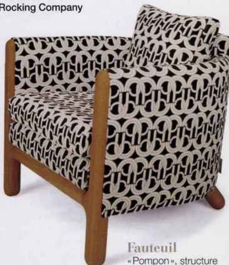
Fauteuil « Pompon », structure en chêne naturel, 2.100 €. Désio