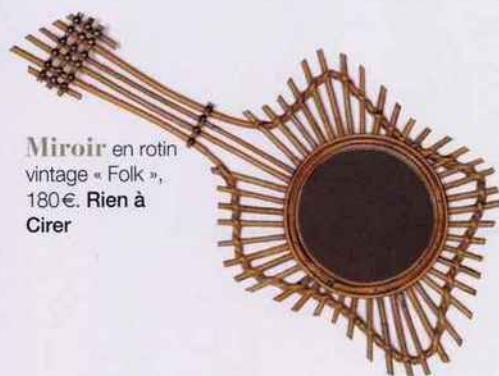
Miroir en rotin vintage « Folk », 180 €. Rien à Cirer