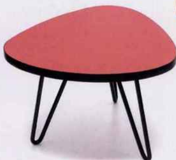
Table « Tica » rouge, inspirées des années 1950, 119 €. The Rocking Company