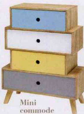
Mini commode en pin et MDF 40x18x53cm, 39,99€. Conforama