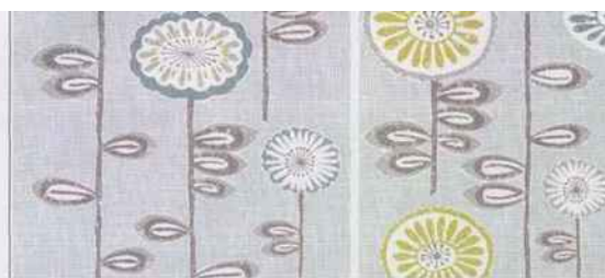
Papier peint «Vintage Flower» bleu, finition grainé intissé. Graham & Brown

La seconde moitié du siècle dernier n'en finit pas d'inspirer les designers d'aujourd'hui. Peut-être parce que ses styles élégants et fonctionnels n'ont pas pris une ride !