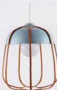
Suspension « Tull » en métal Turquoise/Orange, Ø36,5 cm, 374 €. Incipit sur LightOnline