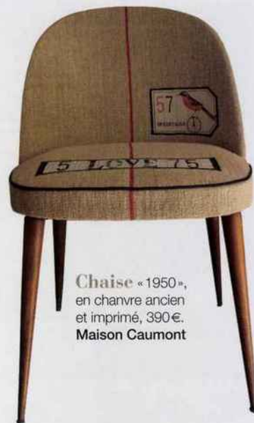
Chaise « 1950 », en chanvre ancien et imprimé, 390 €. Maison Caumont