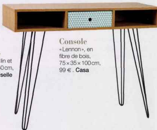
Console «Lennon», en fibre de bois, 75x35x100cm, 99€. Casa