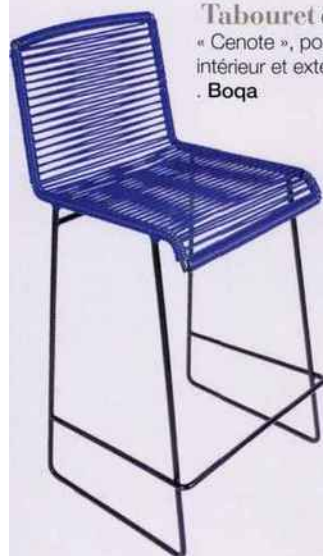
Tabouret de bar « Cenote », pour usage intérieur et extérieur, 229 €. Boqa