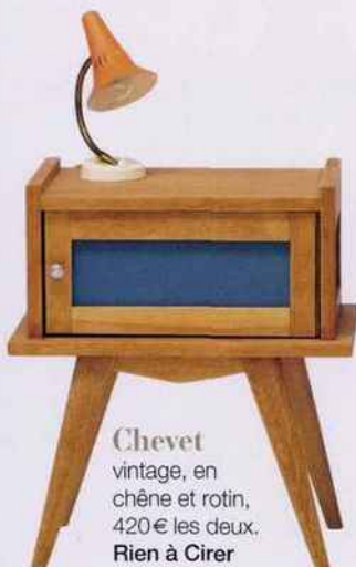
Chevet vintage, en chêne et rotin, 420 € les deux. Rien à Cirer