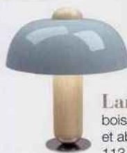
Lampe « Clochette », bois clair, socle chromé et abat-jour en acier, 113 €. Kos Lighting