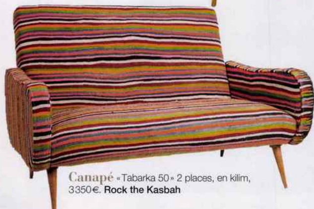
Canapé «Tabarka 50» 2 places, en kilim, 3350€. Rock the Kasbah