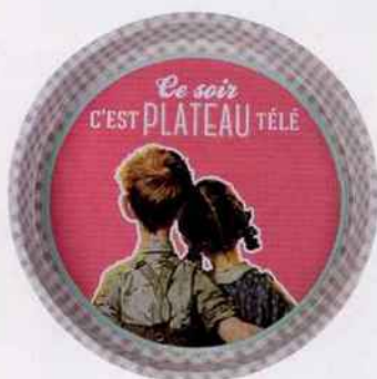
Plateau rond en métal et PVC, 33x4cm, 4€.. GE Concept