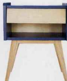
Chevet «Basile», en frêne, 45x35x56cm, 270€. Chouette Fabrique

Sélection & composition : Willy Aboulicam