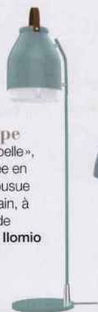
Lampe « Cowbelle », poignée en cuir cousue à la main, à partir de 467 €. Ilomio