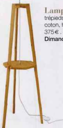
Lampadaire trépieds, en bois, lin et coton, hauteur 150cm, 375€. Mademoiselle Dimanche